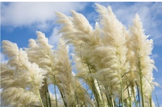
„SEKRETY WSI” - Gazeta Regionalna - Gminy Sułów

Kostrzewa popielata (sina) - trawy ozdobne tworzące kępki niebieskawych liści. Jest zimozielona. Nie zadarnia powierzchni i jest krótkowieczna, ale wygląda bardzo efektownie. Łatwo się rozsiewa.