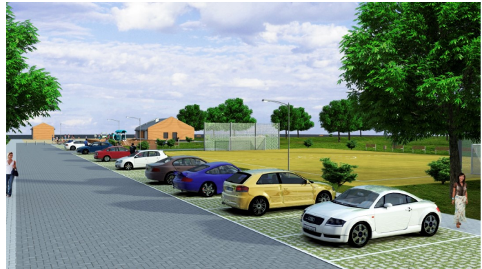
Wizualizacje plaży w Kulikowie

dobrej woli i chęci do pracy odpowiednich ludzi na odpowiednich stanowiskach. Mamy nadzieję, że tak już zostanie na zawsze.