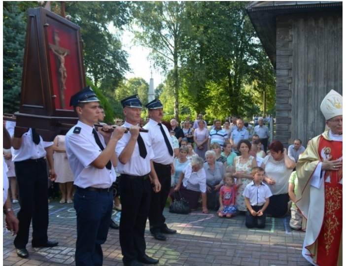
Powitanie Krzyża w parafii Tworyczów